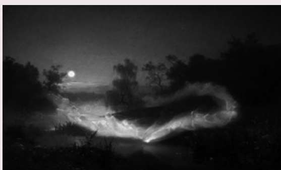
© August Malmström, Fées dansantes , peinture 1866

Plongé dans le noir, les yeux fermés, le public sera invité à suivre une promenade mentale / sensorielle à partir des 533 propositions du livre Œuvres de Édouard Levé (P.O.L éditeur). Œuvres Un livre décrit des œuvres dont l'auteur a eu l'idée mais qu'il n'a pas réalisées.