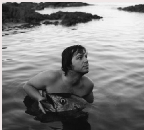
Arnaud Guy