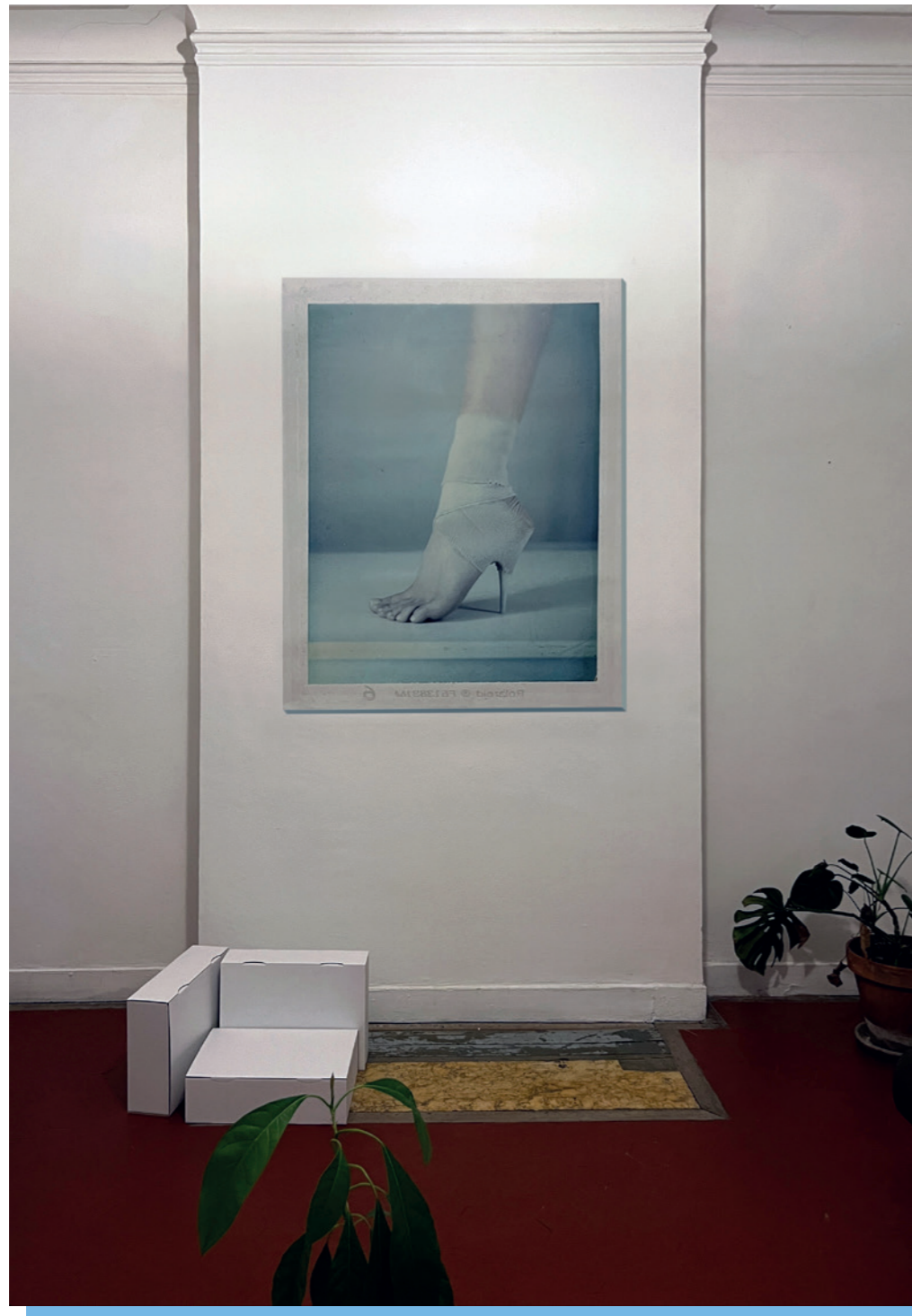
It's a Model Philippe Munda

AS PART OF THE 16 TH « PRINTEMPS DE L'ART CONTEMPORAIN » IN MARSEILLE / DANS LE CADRE DU 16 ÈME PRINTEMPS DE L'ART CONTEMPORAIN À MARSEILLE